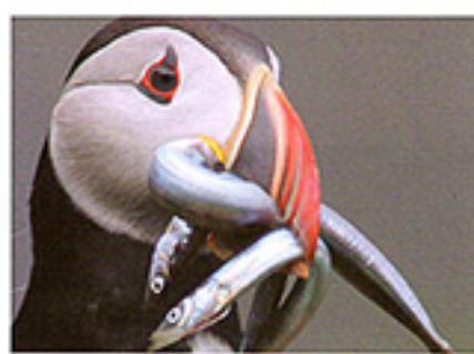
Papageientaucher in Schottland

An Wettbewerben hat er noch nie teilgenommen oder Bilder eingereicht und dennoch zählt er zu den ganz Großen in seiner Branche. „Meine Schwerpunkte sind Landschaften und Tiere.“ Viele bezeichnen den Grazer Fotoprofi als „Maler mit der Kamera“ und als „Meister des Lichts“. Seine Aufnahmen, die Geschichten erzählen und digital