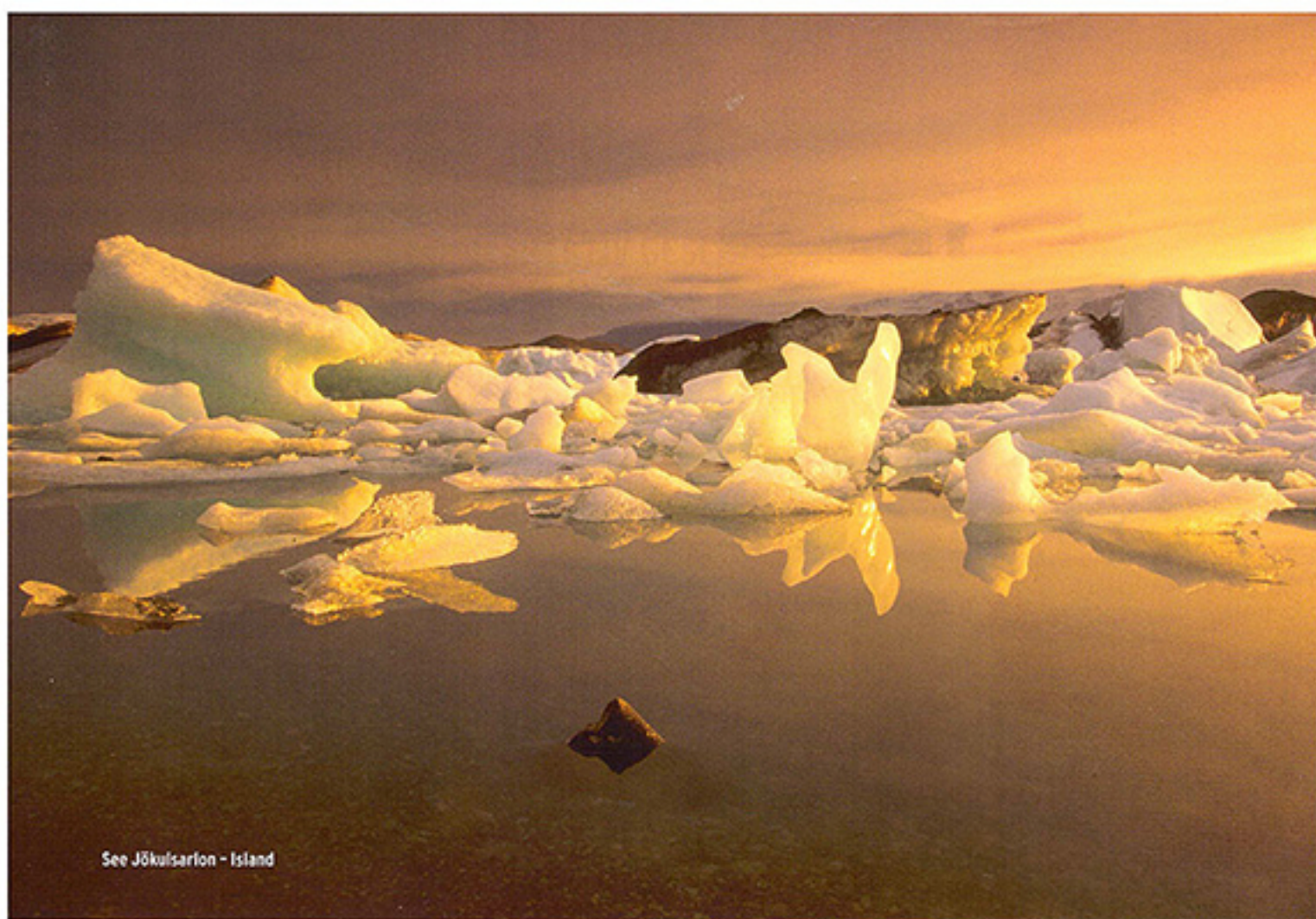
See Jökulsárlón - Island