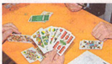
In Spielberg wird wieder geschnapst.