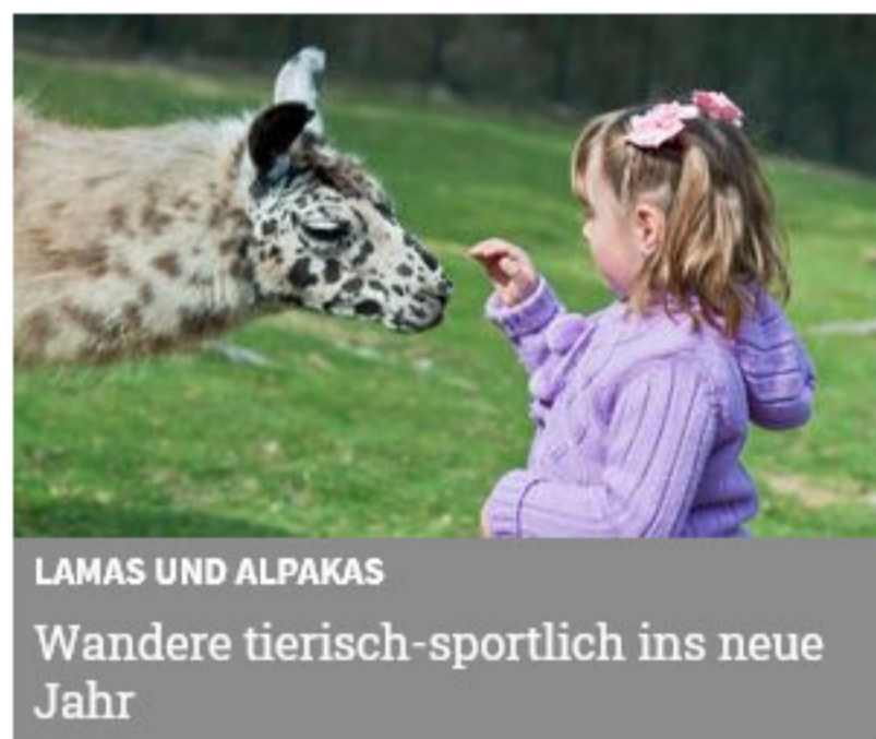
LAMAS UND ALPAKAS Wandere tierisch-sportlich ins neue Jahr

Wer die Multimediashow mit Livemusik der Folk-Gruppe „Boxy“ erleben möchte, hat am 11. Februar um 19.30 Uhr in den Kammersälen Donawitz die Gelegenheit dazu. Tickets sind im Tui-Reisecenter im LCS in Leoben oder an der Abendkasse erhältlich. Sämtliche Termine bis zum 3. April und weitere Informationen sind auf der Homepage www.wolfgang-fuchs.at abrufbar.