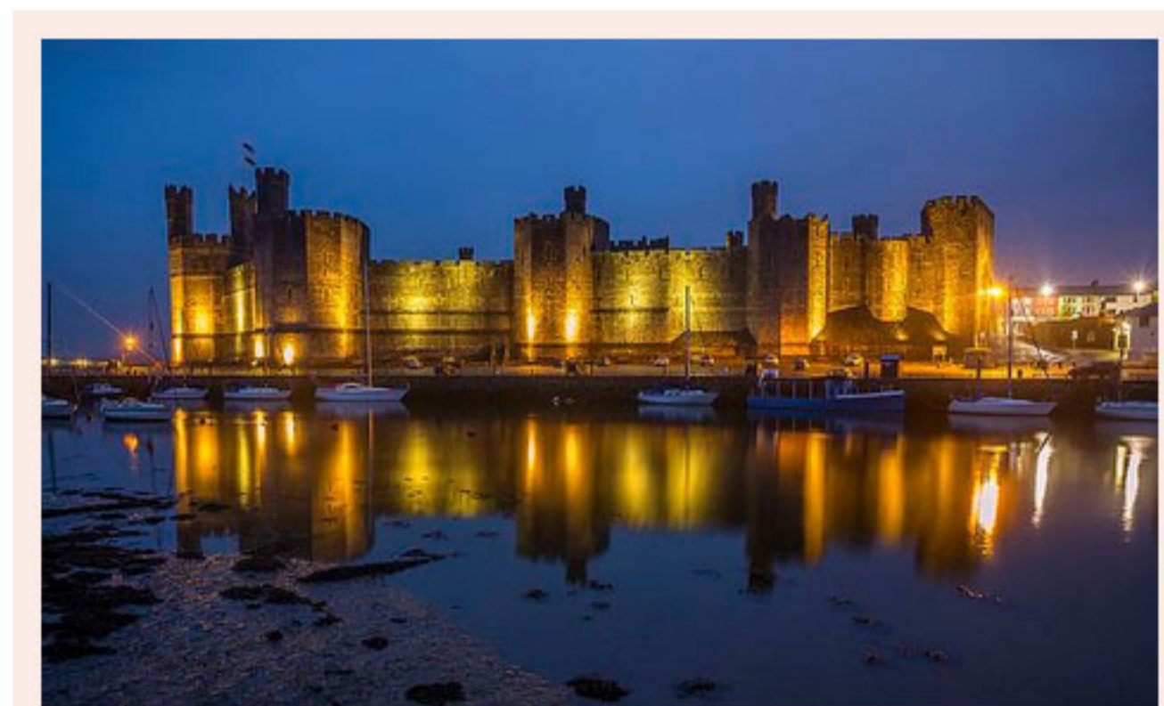
Spektakuläre Aufnahmen aus Wales sind ebenfalls zu sehen

„Vor drei Jahren traf ich jene Surferin, die in einer Kleinstadt angefangen hat, die Strände vom Plastikmüll zu säubern . Inzwischen ist Penzance die erste plastikfreie Stadt Großbritanniens .“ Gut gefallen hat es der Familie Fuchs auch in St. Yves , einer Künstlermetropole, in der das Licht noch wärmer und weicher sei als anderswo.