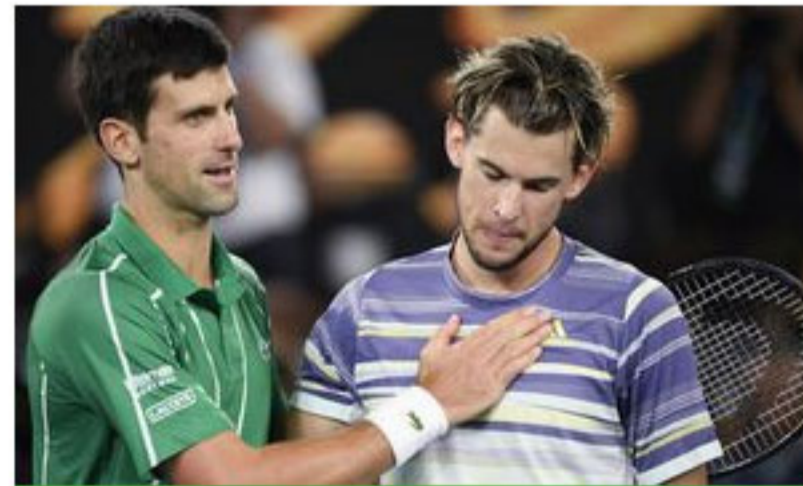
REAKTIONEN ZUM FINALE Djokovic über Thiem: "Du wirst mehr als einen Grand-Slam-Titel gewinnen"