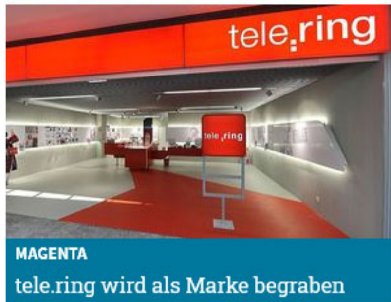
MAGENTA tele.ring wird als Marke begraben