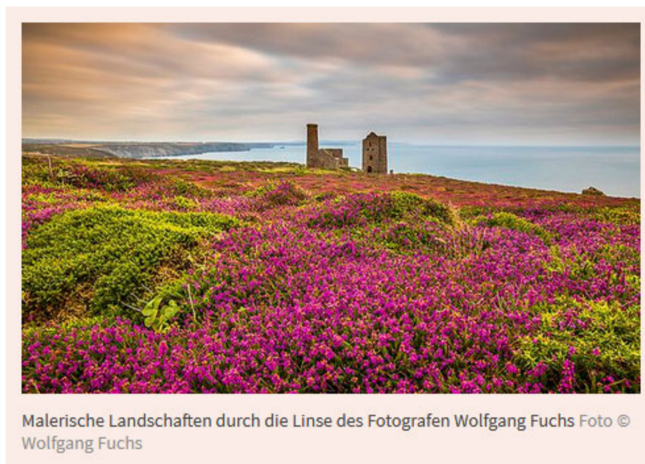
Malerische Landschaften durch die Linse des Fotografen Wolfgang Fuchs