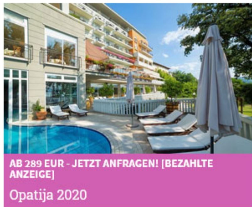
AB 289 EUR - JETZT ANFRAGEN! [BEZAHLTE ANZEIGE] Opatija 2020